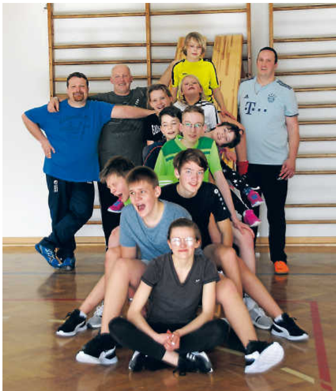
Teilnehmer und Betreuer am Sport- und Spieletag

Bei Witzen am Lagerfeuer und anschließendem Spielen im Vereinsheim endete um 19.00 Uhr dieser schöne Tag. (M.G.)