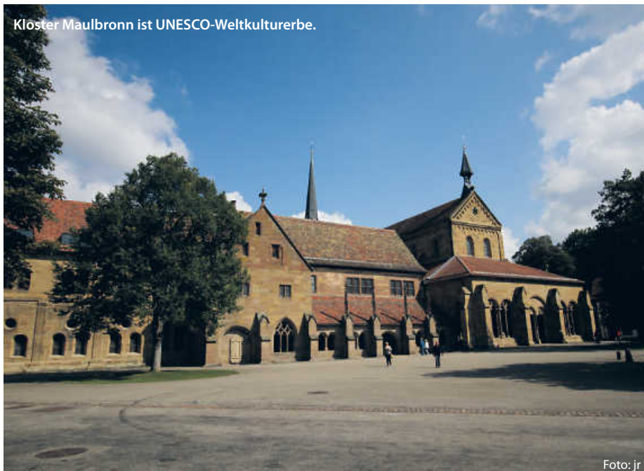
Klöster Maulbronn ist UNESCO-Weltkulturerbe.