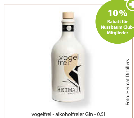
vogelfrei - alkoholfreier Gin - 0,5l

Der Name „Heimat Vogelfrei“ ist neben dem Heimatbezug vor allem ein historisch angelehntes Wortspiel. „Das Wort vogelfrei war früher bezogen auf Menschen, die frei vom Gesetz waren und somit frei von Konventionen oder Normen lebten. Genauso verhält es sich mit unserem Vogelfrei. Als alkoholfreie Spirituose entspricht er nicht unseren alt dahergebrachten Vorstellungen, sondern definiert diese neu, vogelfrei eben. Aber es ist auch ein Wortspiel, vogelfREI von Alkohol“, betont Richter. (haf)