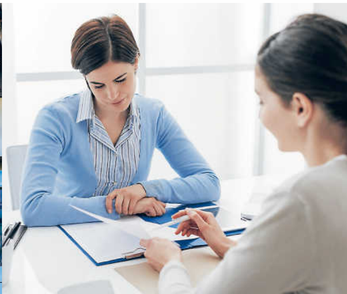
Sei es im Bürgerbüro oder bei der Wirtschaftsförderung – Verwaltungsangestellte sind oft die ersten Ansprechpartner für die Bürger.

Bei der digitalen Ausbildungs- und Jobmesse Karriere BW von Nussbaum Medien am Freitag, 1. Juli, wird auch das vielfältige Tätigkeitsfeld der Verwaltungsfachangestellten beleuchtet.