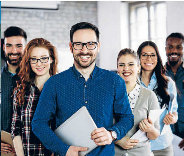
Sei es im Einsatz für Sicherheit und Ordnung oder bei Lehre und Unterricht – im Dienst des Staats sind Beamte gefragt.