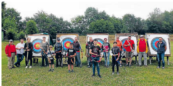
Zweiter Anfängerkurs 2022

Am Samstag, 4. Mai wurde der zweite Anfängerkurs für Bogenschießen abgehalten. Erstmals als Ein-Tages-Kurs. Von 9.00 bis 16.00 Uhr wurde zwischen Theorie und Praxis abgewechselt. Natürlich wurde auch eine Pause abgehalten, mit Würsten und Steaks vom Grill. Die 12 Anfänger wurden von 5 Vereinsmitgliedern betreut. Gegen Nachmittag hat so mancher Neuling festgestellt dass Bogenschießen eine sportliche Betätigung ist und hat Muskeln gespürt, die im Alltag weniger beansprucht werden. Es war ein sehr langer und anstrengender Tag, der den Teilnehmern hoffentlich in guter Erinnerung bleiben wird. Der Vorstand wünscht allen Teilnehmern weiterhin viel Spaß beim Bogensport. (GüVo)