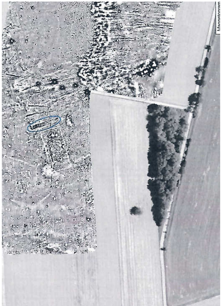
Geomagnetische Messung Harald von der Osten September 2020