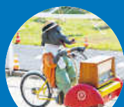
Jochen der Elefant

Verspielt, eigensinnig und manchmal auch tänzerisch – Clowns, die künstlerische Welten erschaffen und zum Träumen und Verweilen einladen.