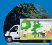
Die rollende Kinderturn-Welt

Schönste Melodien und flotte Rhythmen präsentiert von einem einzigartigen Ensemble mechanischer Musikapparaturen und seinem Musikmaschinenisten. Ein musikalisches Wunderwerk!