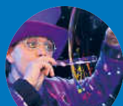
Sabrina und Blub

Gemeinsam mit dem „Medienkompetenz Team e.V.“ aus Karlsruhe bespielen wir am Familientag den Gartenschau-Pavillon zum Thema „Medienkompetenz stärken“. Im Pavillon wird es 6 Live-Infoveranstaltungen à 45 Minuten, Infostände und einen Workshop mit Arbeitsplätzen für Kinder geben, die an einen sicheren Umgang mit Medien herangeführt werden sollen.