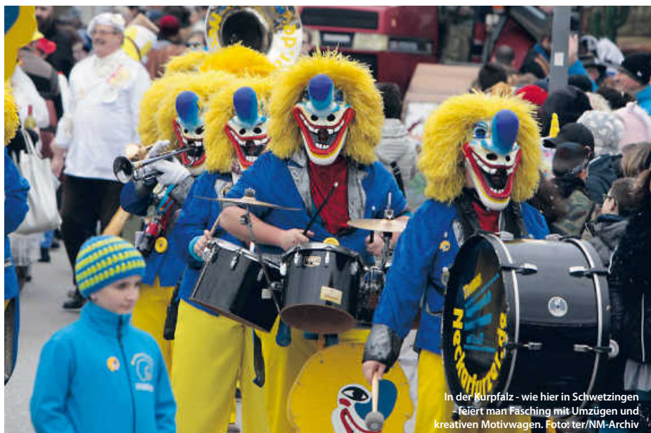
In der Kurpfalz - wie hier in Schwetzingen - feiert man Fasching mit Umzügen und kreativen Motivwagen.

Geht der Tag dann seinem Ende zu, heißt es Abschied nehmen. Besonders zelebriert wird das zum Beispiel in Bad Waldsee. Wenn die Schrättele ihre Besen verbrennen, wird die verblichene Fasnet in Form einer Strohuppe unter lautem Klagen den Fluten des Schlossbachs übergeben. Andernorts wird sie beerdigt. Am Aschermittwoch ist dann alles vorbei – fast, denn jetzt heißt es, Geldbeutel waschen, die närrischen Tage haben die Börse geleert. Da bleibt nur noch die Rückgabe des Rathausschlüssels und Fasten – ganze 40 Tage, bis Ostern. (jr/red)