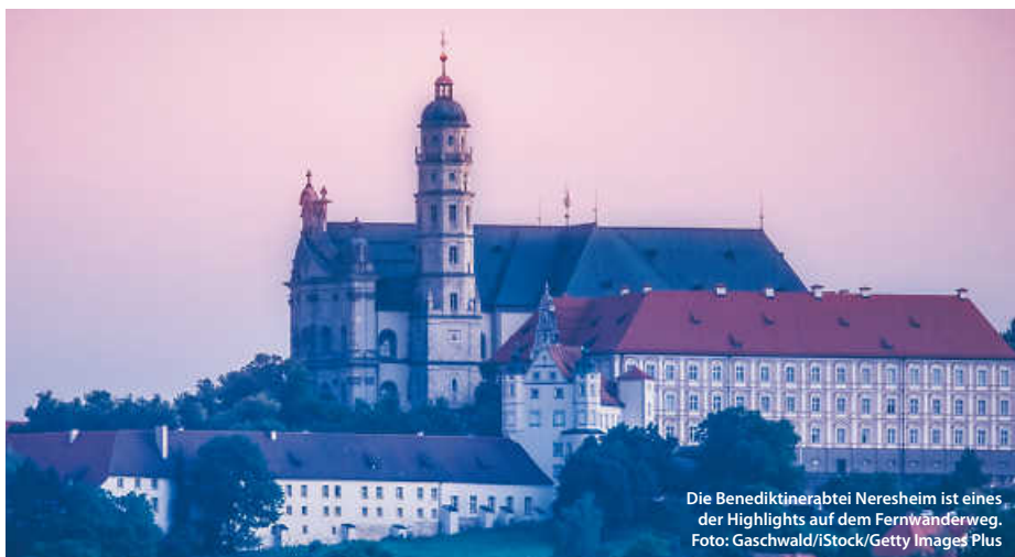
Die Benediktinerabtei Neresheim ist eines der Highlights auf dem Fernwanderweg.

Und natürlich warten überall Schafe: Heute noch bewirtschaftete Schafhöfe, uralte Schaftriebe, die Kultur des Schäferlaufes – sie alle geben spannende Einblicke in die Kultur der Schäfer, die die Region bis heute einzigartig und vor Ort erlebbar machen. (haf/jr)