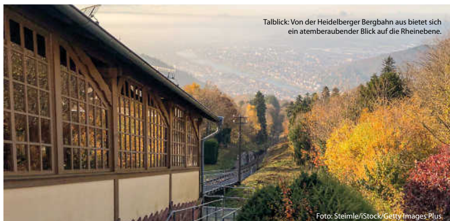
Talblick: Von der Heidelberger Bergbahn aus bietet sich ein atemberaubender Blick auf die Rheinebene.

Baden-Baden ist nicht nur als Kurstadt bekannt, sondern auch für seinen Hausberg, den Merkur. Die Merkurbergbahn führt über eine Länge von 1,2 Kilometern auf den 668 Meter hohen Gipfel. Der Merkururm überragt den Gipfel noch um 23 Meter. Von dort kann man sogar bis zu den Vogesen schauen oder den Gleitschirmfliegern bei den Startvorbereitungen und beim Abheben zusehen. (sh)