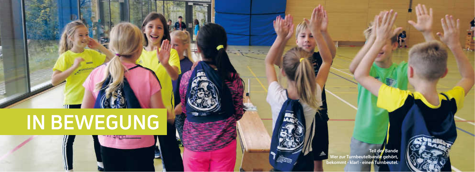
Teil der Bande Wer zur Turnbeutelbande gehört, bekommt - klar! - einen Turnbeutel.