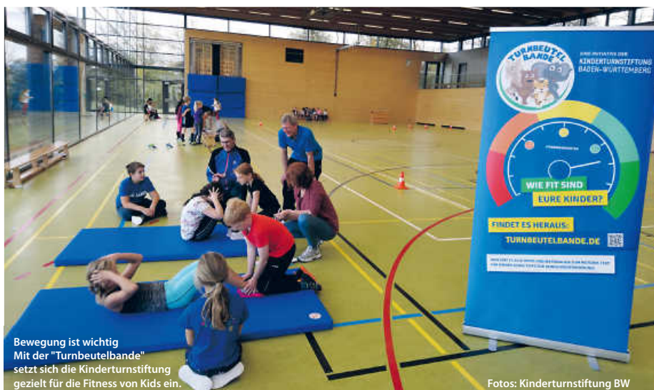
Bewegung ist wichtig Mit der „Turnbeutelbande“ setzt sich die Kinderturnstiftung gezielt für die Fitness von Kids ein.

Übrigens: Für die fünf ersten Kommunen, die den Motorik-Test für Kinder bei sich durchführen wollen, bietet die Kinderturnstiftung Baden-Württemberg eine kostenlose digitale Schulung an. Im Rahmen der etwa zweistündigen Veranstaltung wird der Test vorgestellt und es werden Tipps zur erfolgreichen Organisation und Durchführung gegeben, Kontakt hier: info@turnbeutelbande.de (pm/red)