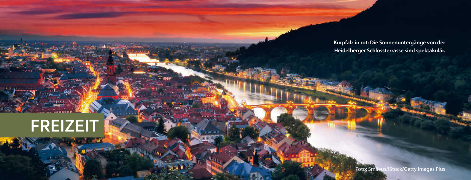
Kurpfalz in rot: Die Sonnenuntergänge von der Heidelberger Schlossterrasse sind spektakulär.