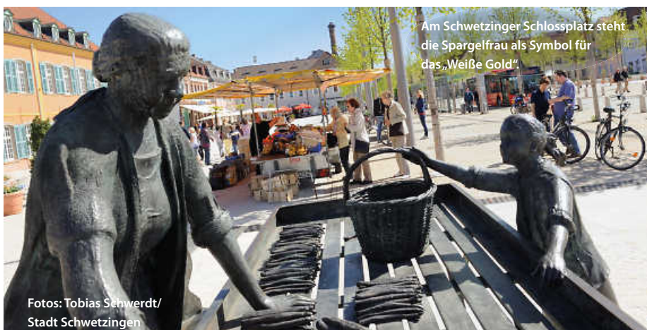
Am Schwetzingener Schlossplatz steht die Spargelfrau als Symbol für das „Weiße Gold“

In den Städten und Gemeinden entlang der Route laden kleine Museen ein, in die jeweilige Lokalgeschichte einzutauchen. Thematisiert wird dort zum Teil auch die Historie des Spargelanbaus, zum Beispiel im Römermuseum Stettfeld. Größere und kleinere Events und kulinarische Feste rund um die weißen Stangen in der Orten der Spargelstraße, wie beispielsweise der Walldorfer Spargelmarkt, laden zum Schlemmen und Genießen ein. (dyh/jr)