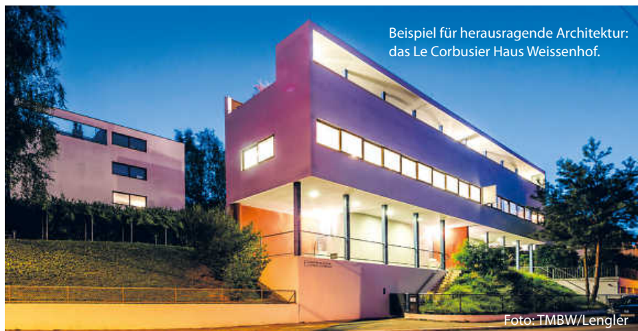
Beispiel für herausragende Architektur: das Le Corbusier Haus Weissenhof.

Und in der Stuttgarter Weissenhofsiedlung ist der Eintritt zum Museum nicht nur den ganzen Tag frei, auch die architektonischen Highlights von Le Corbusier können dort in Sonderführungen erkundet werden. (jr)