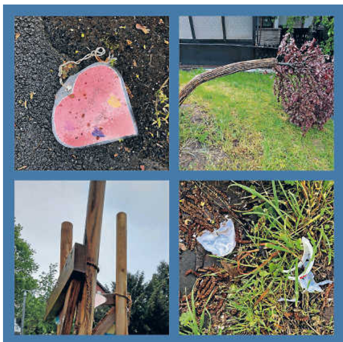
So bitte nicht!