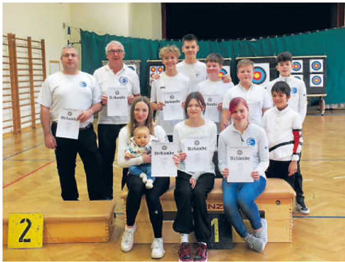
Die Teilnehmer des BSV Schefflenz bei der Kreismeisterschaft

Gratulation der Vorstandschaft an die Teilnehmer und vielen Dank an die Helfer. (GüVo)