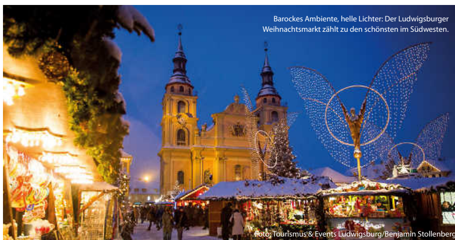
Barockes Ambiente, helle Lichter: Der Ludwigsburger Weihnachtsmarkt zählt zu den schönsten im Südwesten.

Oder kleine, liebevoll inszenierte Adventsmärkte in stimmungsvoller Kulisse, zum Beispiel im Maulbronner Klosterhof zum 2. Advent, oder der Adventsmarkt im Bruchsaler Schlosshof unter der erleuchteten Schlossfassade. Ein Besuch lohnt sich ... (jr/su/red)