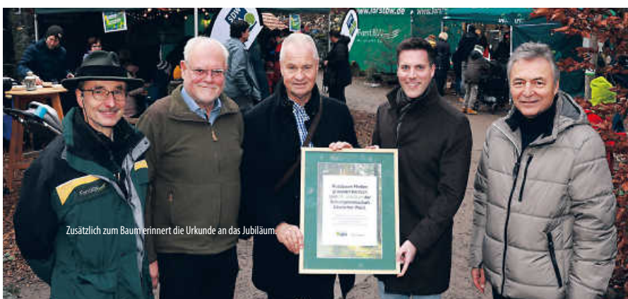
Zusätzlich zum Baumerinnert die Urkunde an das Jubiläum

Mit der Elsbeere hat man für die Pflanzung einen klimaresistenten, heimischen Laubbaum gewählt, der sich sehr gut für trockene bis sehr trockene Standorte in warmen Regionen eignet. Elsbeeren können zwischen 20 und 30 Meter hoch werden und sind aufgrund ihrer Eigenschaften ideal für den Waldbau im Klimawandel. Weil Nadelwälder aufgrund der globalen Erwärmung stark geschädigt sind und keine gute Zukunft haben, sollen sie durch laubholzreiche Mischwälder ersetzt werden. Neben Traubeneichen, Hainbuchen und Linden werden deshalb auch Elsbeeren gepflanzt, die bestens an das künftige Klima angepasst sind. (dyh)