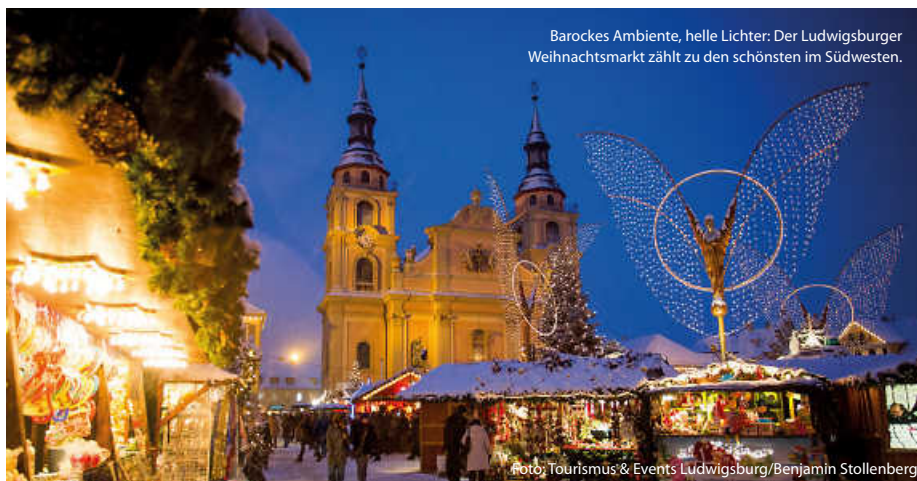
Barockes Ambiente, helle Lichter: Der Ludwigsburger Weihnachtsmarkt zählt zu den schönsten im Südwesten.

Oder kleine, liebevoll inszenierte Adventsmärkte in stimmungsvoller Kulisse, zum Beispiel im Maulbronner Klosterhof zum 2. Advent, oder der Adventsmarkt im Bruchsaler Schlosshof unter der erleuchteten Schlossfassade. Ein Besuch lohnt sich ... (jr/su/red)