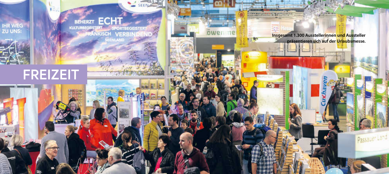
Insgesamt 1.300 Ausstellerinnen und Aussteller präsentieren sich auf der Urlaubsmesse.