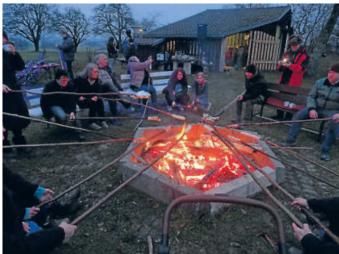
Gemütliches Zusammensein am BSV Lagerfeuer

nach trafen alle ein. Es gab viel zu erzählen, hatten wir uns doch längere Zeit nicht mehr gesehen. Als unser Lagerfeuer richtig brannte, konnte man sich auch daran wärmen. Später, als genügend Glut vorhanden war, ging es ans Stockbrot backen. Viele haben sich besonders darauf gefreut, da es nicht oft die Gelegenheit gibt Stockbrot zu backen. Es kamen auch wieder neue, selbst gebaute Geräte zum Einsatz, um Würste zu braten. Es ist zu vermerken, dass die Technik immer ausgereifter wird. Im Dunklen kam dann die Beleuchtung zur Geltung und in Verbindung mit Musik und dem Lagerfeuer war es eine schöne, gemütliche, entspannte Runde um das Lagerfeuer. Der Abschluss fand dann am Tresen im Clubheim statt. Danke an alle, die zum guten Gelingen des Wintergrillens beigetragen haben.