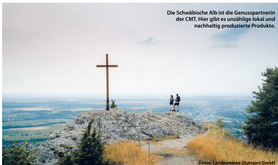
Die Schwäbische Alb ist die Genusspartnerin der CMT. Hier gibt es unzählige lokal und nachhaltig produzierte Produkte.

Auch das zweite CMT-Wochenende, vom 18. bis 21. Januar, hält für Aktiv-Urlauberinnen und Urlauber einiges bereit: In Halle 9 zeigen dann Ausstellerinnen und Aussteller, welche Reisen Sie zum Thema Golf, Wellness und Kreuzfahrten in petto haben. Zu entdecken gibt es also wahrlich vieles. (pm/red)