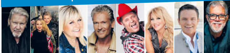
Johnny Logan, Markus & Yvonne (Neue Deutsche Welle), Gaby Baginsky, Stefan Mross, Olaf Berger, Rosanna Rocci, Markus Becker und Wolfgang Trepper mit einer Comedy Show.