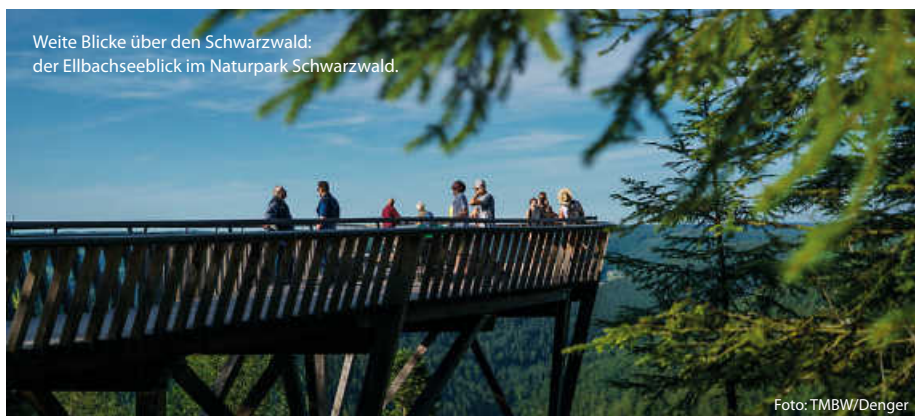
Weite Blicke über den Schwarzwald: der Ellbachseeblick im Naturpark Schwarzwald.

Schon von Weitem ist der Aussichtsturm im Naturpark Schönbuch zu sehen. Die 35 Meter hohe Holz-Stahl-Konstruktion auf dem Stellberg ragt weit über die umliegenden Bäume im ältesten Naturpark Baden-Württembergs hinaus. 348 Stufen erschließen den filigranen Turm und führen zu drei Aussichtsplattformen in 10, 20 und 30 Metern Höhe. Ganz oben kann man nicht nur dem Schönbuch auf sein Blätterdach schauen; auch die Schwäbische Alb und der Schwarzwald erscheinen von hier zum Greifen nah. (TMBW/red)