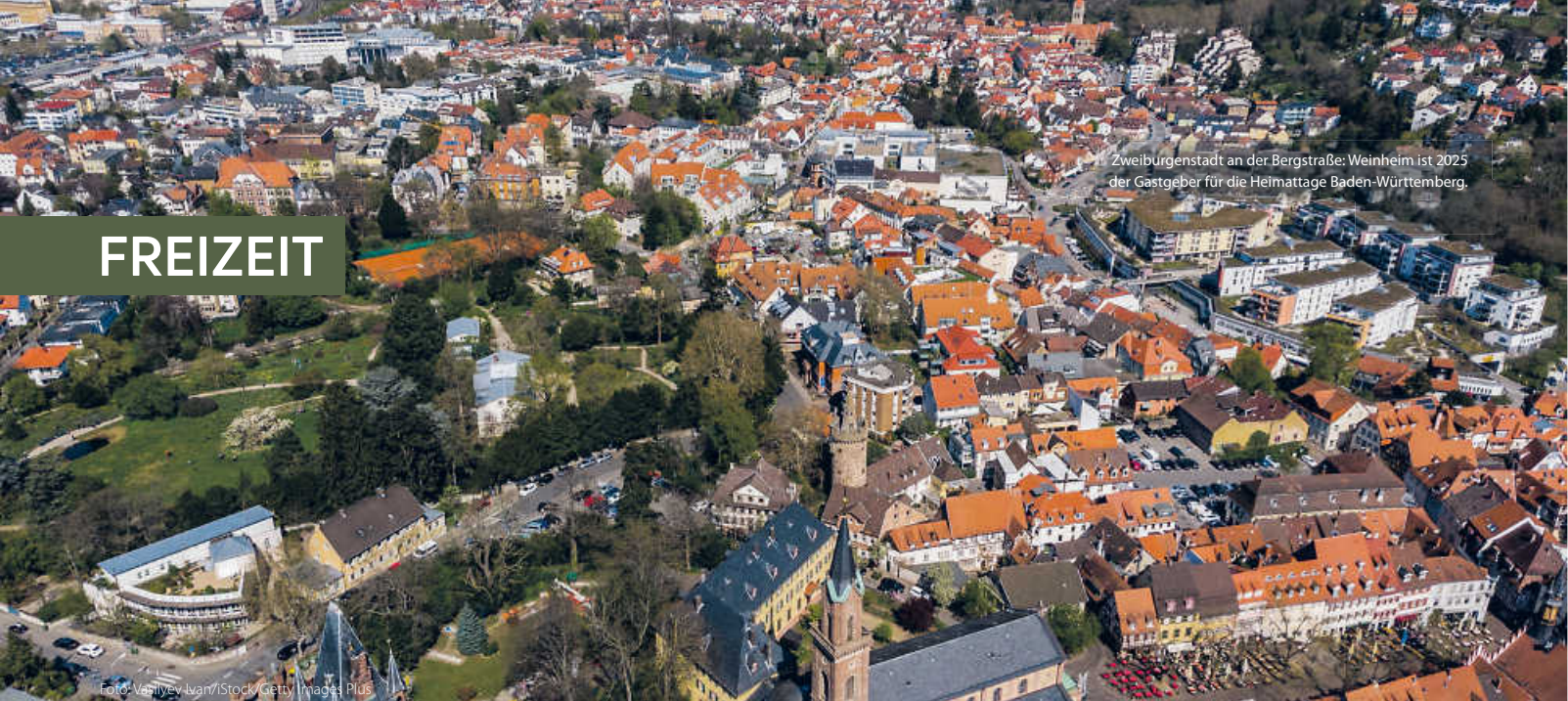
Zweiburgstadt an der Bergstraße: Weinheim ist 2025 der Gastgeber für die Heimattage Baden-Württemberg.