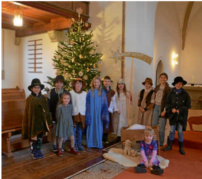
Im Familiengottesdienst an Heiligabend haben die Kinder das Krippenspiel „Der kleine Hirtenjunge und der große Räuber“ aufgeführt.

tesdiensten großzügig für „Brot für die Welt“ gespendet haben • allen, die sich darüber hinaus auf unterschiedliche Weise eingebracht haben und zu einem guten Miteinander in unserer Gemeinde in der Advents- und Weihnachtszeit beigetragen haben