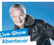
Live-Show Abenteuer Weltumrundung