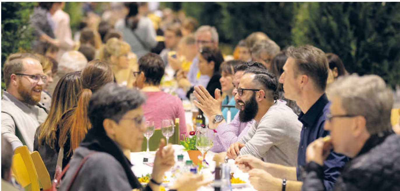
Der Markt des guten Geschmacks mit seinem Wahrzeichen - der Langen Tafel