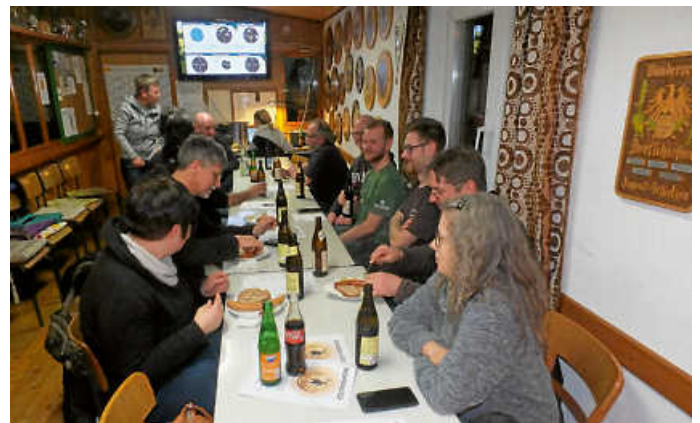
Gemütliches Beisammensein im Schützenhaus