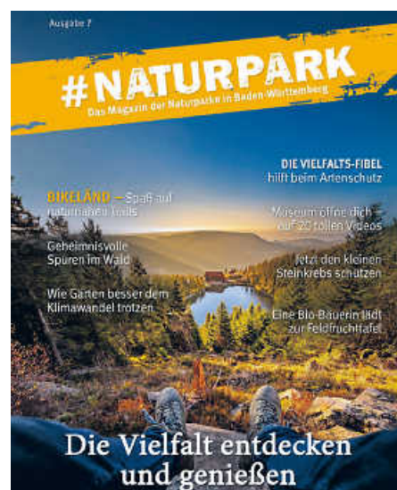
Das jährlich erscheinende Magazin #Naturpark beleuchtet nachhaltige Regionalentwicklung und kulturelles Erbe.

Rückkehr des Storchs im Naturpark Stromberg-Heuchelberg bieten besondere Einblicke. Mit den Blumen- und Genussworkshops im Naturpark Obere Donau oder den Veranstaltungen zum Limes-Jubiläum im Naturpark Schwäbisch-Fränkischer Wald sowie mit dem Bikeländ in Eberbach im Naturpark Neckartal-Odenwald liefert das Magazin Unternehmungstipps für Groß und Klein. In Sachen Genuss hat der Schwarzwald einiges zu bieten, wie man im Beitrag über das Videoprojekt der Naturpark-Wirte der beiden Schwarzwälder Naturparke erfährt. Einen Besuch wert sind auch stets die Naturpark-Zentren der sieben Naturparke – was man dort außer reiner Wissensvermittlung erleben kann, erfährt man ebenso auf vier der insgesamt 69 Seiten des Magazins. (pm/red)